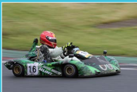
ついにYUUKAの連勝を止めたSK1ゼンタ。文句なしのパーフェクトウィンだった