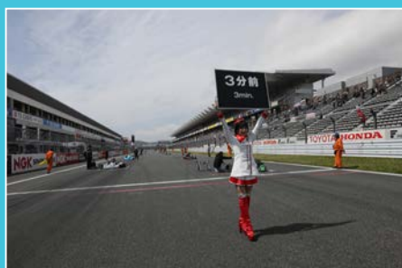
予選は若干、雨が残りハーフウェットだったが決勝は完全なドライのレースになる