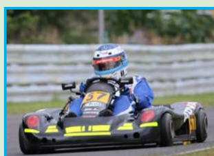
▲YZ125クラスで優勝したFUJIGANEレーシングサービス