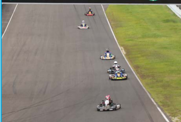
▲曇り空のもと決勝スタート。レースも終盤に差し掛かったところで雨が降り出すが雨足が強まる前にチェッカーを迎えた