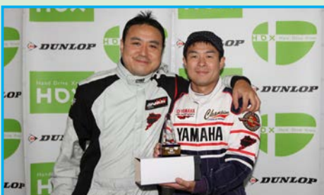
▲SUGOでは初となる総合トップを獲得したADVANてるてるレーシング。SUGOはコースが面白いので毎年、楽しみにしているそうだ。ちなみに2人は会社の同僚だ