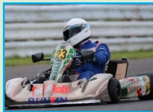
▲YZ285を制したTR☆れ〜しんぐ!+ぶなん